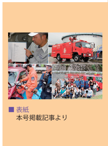
■ 表紙 本号掲載記事より